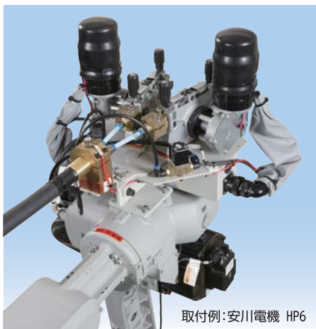
取付例: 安川電機 HP6